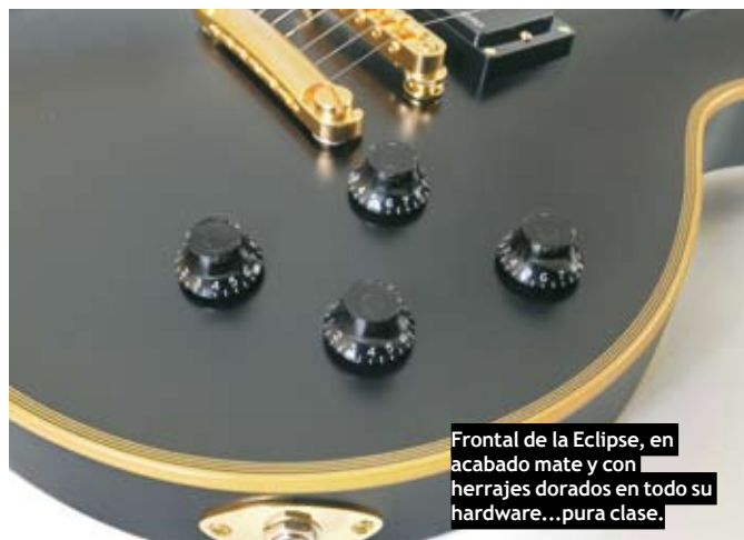
Frontal de la Eclipse, en acabado mate y con herrajes dorados en todo su hardware...pura clase.

A lo largo de sus 22 trastes generosos marcadores tipo "bandera" en nácar, incluido también en el traste 1 (y a la altura del 12 las credenciales del